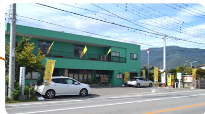
山梨県教化部外観

1月17日(水) 7月10日(水) 2月18日(日) 8月24日(土) 3月13日(水) 9月18日(水) 4月10日(水) 10月20日(日) 5月15日(水) 11月16日(土) 6月16日(日) 12月11日(水)