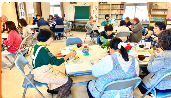
ノーミート料理で心も身体も健康に！

個人相談 何かご心配やお困りのことがございましたらご相談（無料）を受け付けます。