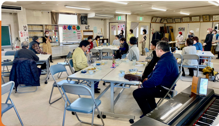
初めての方もお気軽にご参加ください！

そこで皆さんがコミュニケーションをとる、気軽に人と会う、話ができる、豪華でないけれど家庭的で身体に良いお食事いただける。そういう場を提供できれば良いと思っています。地域に開かれた役割を果たすことで、人々が声を掛け合い助け合う社会の再生の一助となることを目指したいと考えております。