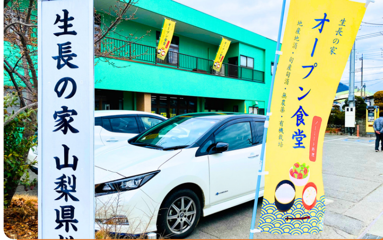
黄色ののぼり旗が目印です！