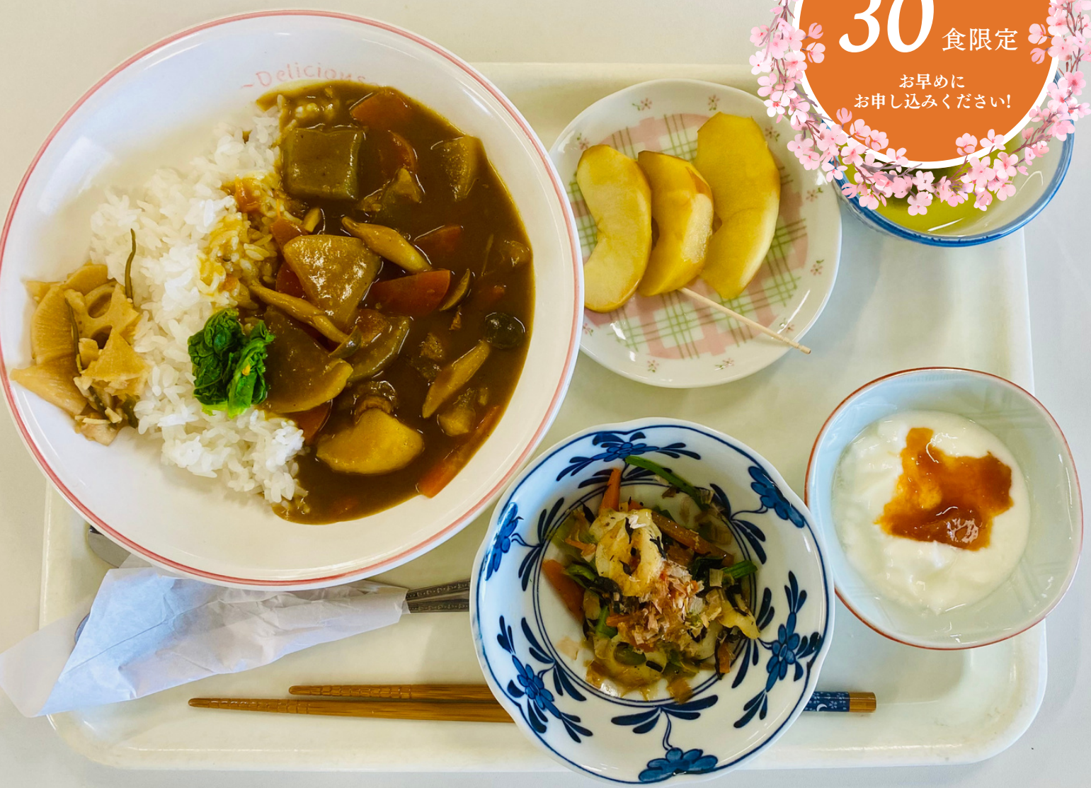
料理写真は3月に提供したメニューです。