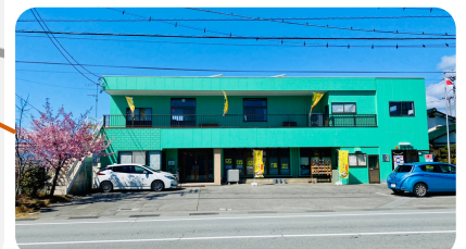
山梨県教化部外観

1月17日(水) 7月10日(水) 2月18日(日) 8月24日(土) 3月13日(水) 9月18日(水) 4月10日(水) 10月20日(日) 5月15日(水) 11月16日(土) 6月16日(日) 12月11日(水)